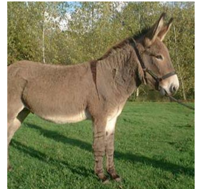
Ane du Cotentin