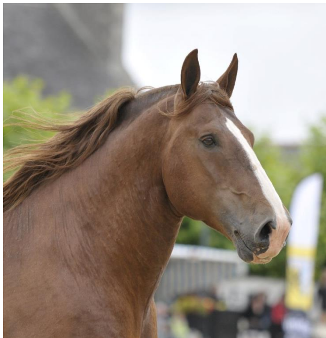
Cheval de Trait Breton